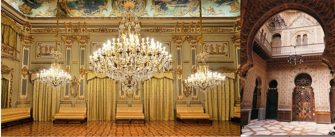
Salón de Baile del Real Casino de Murcia

lugares más sorprendentes, el Real Casino de Murcia, joya ecléctica, donde destacan entre otras cosas, su Salón de Baile, Biblioteca, El Patio Azul, como anécdota decir que ha sido sede del Campeonato del Mundo de Billar a Tres Bandas. A las 18'00 horas, Visita Guiada al Real Casino de Murcia,