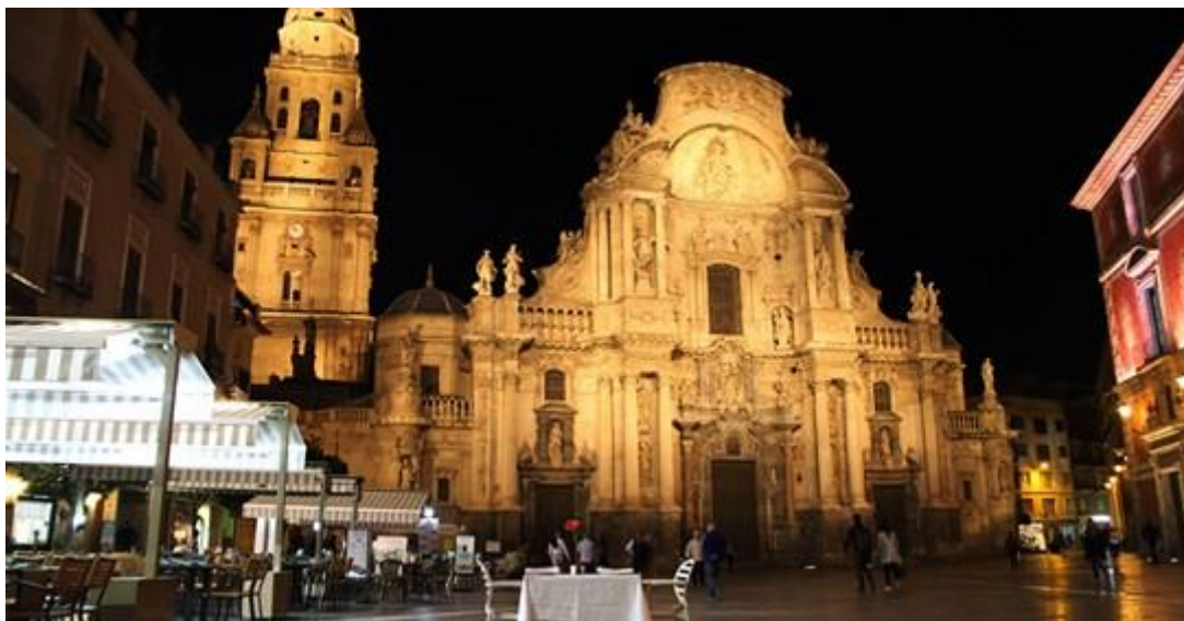
Vista Nocturna de la Plaza Cardenal Belluga

Si el tiempo lo permite, que va a ser que sí, en una terraza del lugar más emblemático de Murcia, disfrutaremos de una cena de Tapas Murcianas, en el Restaurante el Portal de Belluga , este se encuentra ubicado en la Plaza del mismo nombre, frente a la fachada principal de la Catedral de Murcia. Un lugar único y con una cocina fantástica.