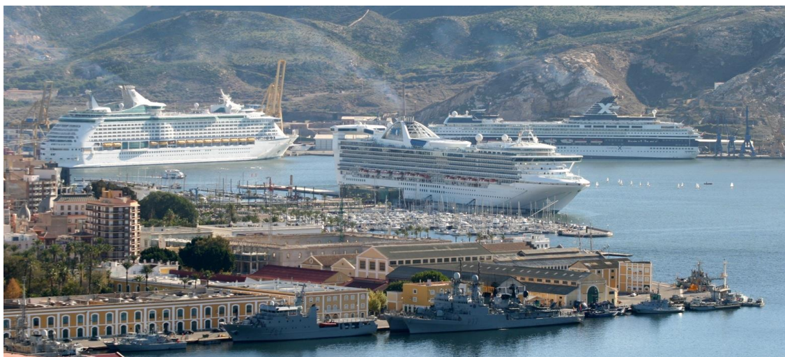
Vista del Puerto de Cartagena – Dársena de Cruceros – Dársena Militar.