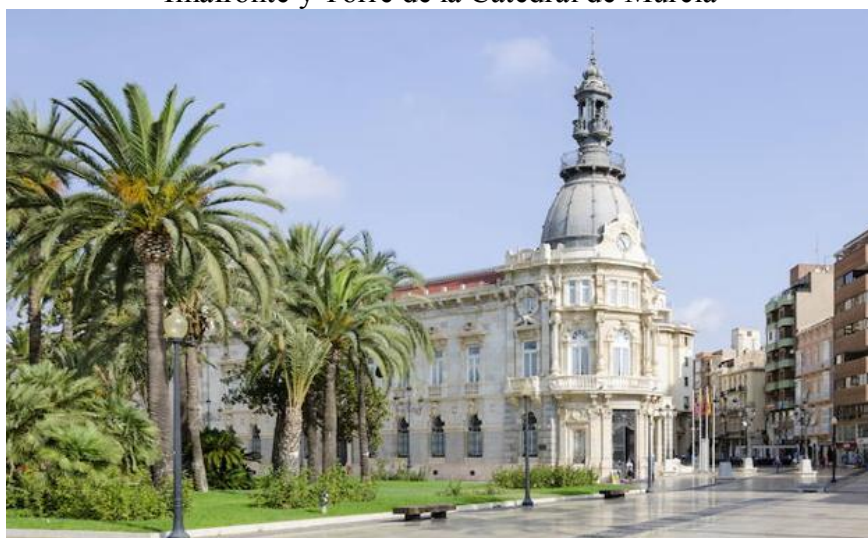
Ayuntamiento de Cartagena

El Club Social de Cajamurcia, a través de su Foro Almursí en su afán de continuar en la línea de aunar, cultura, gastronomía, diversión y compañerismo, no nos hemos podido resistir a colaborar para que podáis disfrutar “una miajica”, de lo que es la Región de Murcia, dado el poco tiempo que vais a estar por estos pagos.