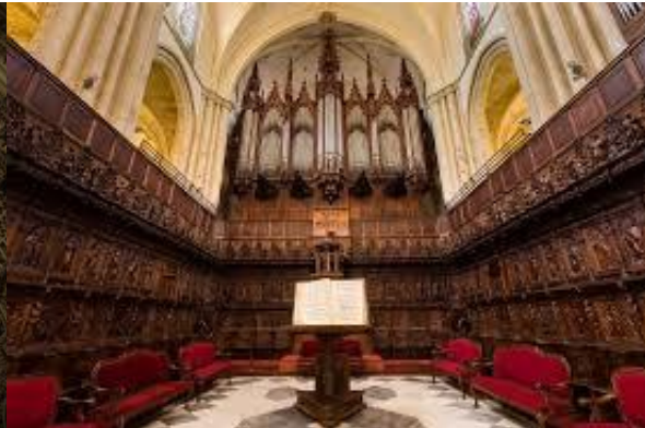
Vista parcial del Coro y Órgano