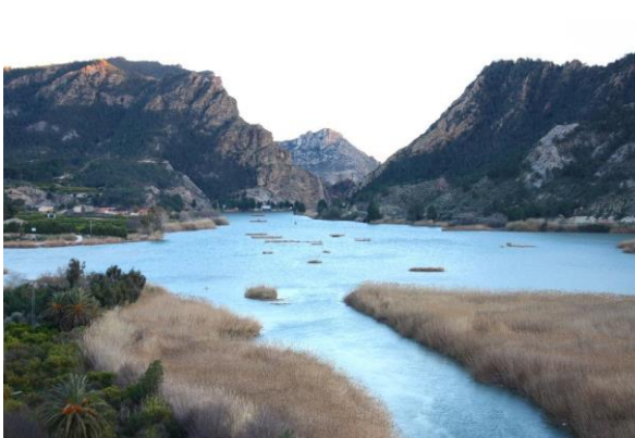
Vista del Valle de Ricote

Acabado el desayuno en el hotel , se partirá cada cual en su vehículo particular con el equipaje a bordo hacia la localidad de Archena, lugar donde quedaran estacionados los vehículos, una vez que un autobús y un guía local nos recogerán para realizar una Ruta por la Murcia interior, en donde entre otras cosas visitaremos el Valle de Ricote , paraje que recuerda un oasis en mitad del desierto, lugar que fue el último reducto de los moriscos en España antes de su total expulsión durante el reinado de Felipe III en el año 1.611. También visitaremos el pintoresco pueblecito de Ojós y su azud , así como su curioso Museo de Belenes del Mundo, dependiente del MUBAM , que os sorprenderá.