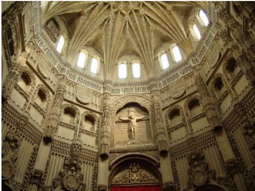
Capilla de los Vélez.

Terminada la comida, regresaremos a Murcia , a la que llegaremos sobre las 18'00 horas , de la tarde, para continuar con las visitas, una de las cuales se centrará en La Catedral , obra cumbre del Barroco, en la que destacan su Torre , de 95 metros la segunda más grande de España, el Imafrente , auténtico retablo en piedra, el órgano Merklin , el más grande de Europa con 5.500 tubos, y dos de sus Capillas , la de Junterón que ha dado nombre a un estilo artístico el Barroco Murciano, y la más conocida la Capilla de los Vélez . Todo se combinará con un breve paseo por las calles más recoletas de Murcia, para una vez acabada tener Tiempo Libre, y Noche Libre, para disfrutar de la noche, y de las zonas gastronómicas de Murcia, no en vano Murcia ha sido designada como “Capital Gastronómica de España 2020”