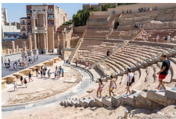
Teatro Romano de Cartagena

Tras el desayuno en el Hotel, nos dirigiremos en autobús la conocida como Ciudad Departamental, Cartagena , en donde de la mano de un guía oficial el cual nos conducirá por los entresijos de esta milenaria localidad. Veremos entre otras cosas, el Teatro Romano y su Museo , restauración llevada a cabo por Moneo, y que por extraño que parezca, no generó ninguna polémica todos estuvieron de acuerdo en su fantástica labor. - Foro Romano , En el Corazón de la Ciudad levantaron los romanos su Foro, hoy comienza a resurgir maravilloso. El Decumano ; Admiraremos El Modernismo Cartagenero , (Cartagena se encuentra dentro de la llamada Ruta Modernista Internacional), destaca sobremanera su Ayuntamiento, (Foto al comienzo de la Convocatoria), y sus edificios a lo largo de la Calle Mayor y Calle del Carmen, Visitaremos también el lugar donde se encuentra el Submarino Peral , primer submarino verdaderamente operativo.