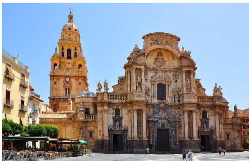
Imafronte y Torre de la Catedral de Murcia